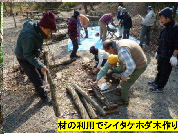
材の利用でシイタケホダ木作り