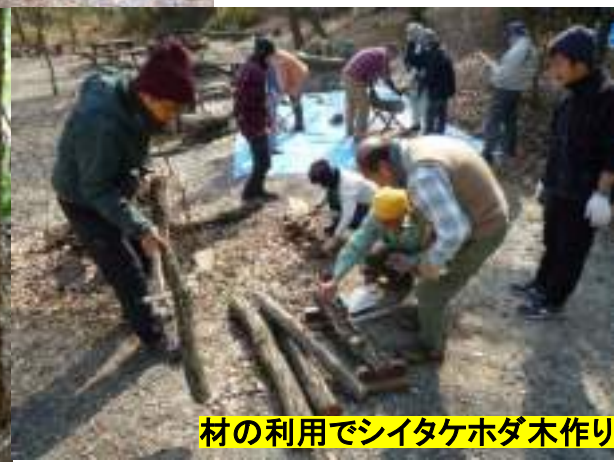
材の利用でシイタケホダ木作り