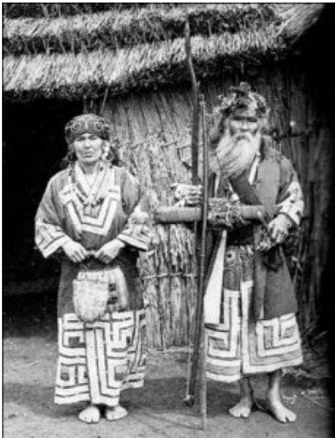
RISA WORKS HP 先住民族「アイヌ」を知る展より

自然界から何かをいただく それを余すところなく使う いただいた命によって 人間は生かしてもらっている