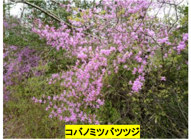
コバノミツバツジ