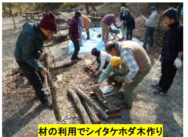
材の利用でシイタケホダ木作り