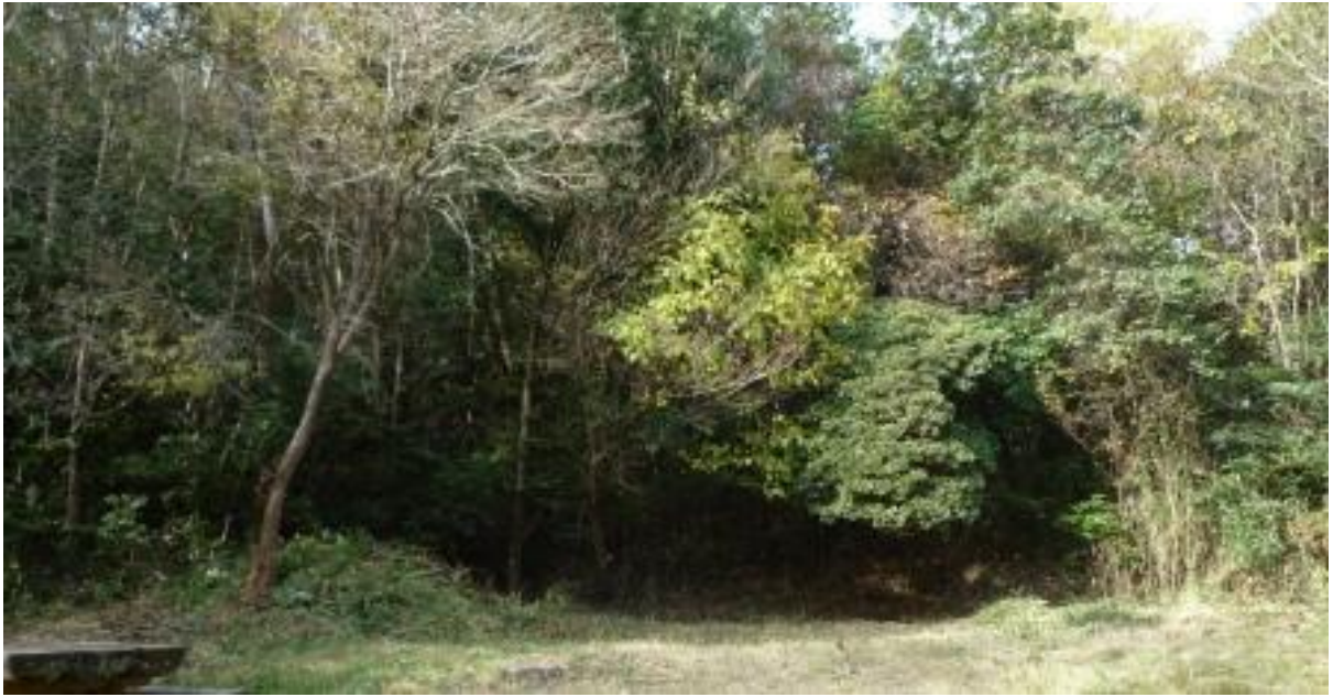
ササの繁茂や常緑樹の台頭で暗くて繁雑な森になっている